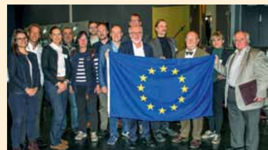
Die deutsche UEF-Delegation in Paris