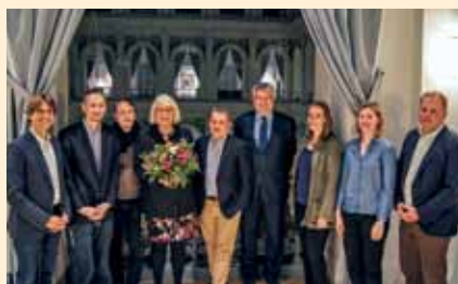
Der neue Vorstand

Der neugewählte Vorstand informierte die Mitglieder, dass im Frühjahr 2018 eine Mitgliederbefragung geplant sei und die