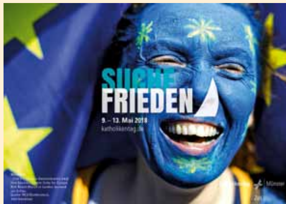
Grafik: Katholikentag

„Suche Frieden“ heißt das Thema des Katholikentags diesmal. Es nimmt Bezug auf zwei besondere Jahrestage, die 2018 zu begehen sind: Ab 1618 versank Europa in Gewalt und Zerstörung des 30-jährigen Krieges, 1648 wurde in Münster der „Westfälische Frieden“