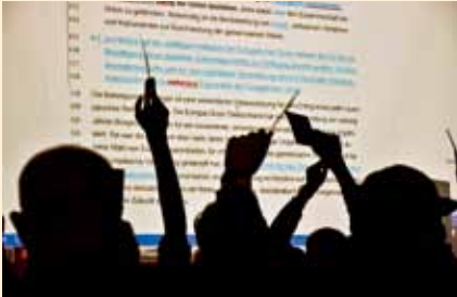
Beratungen im Änderungsmodus: Die Resolution „Reformchancen nutzen“ wurde engagiert diskutiert und am Ende einstimmig beschlossen.

Mehrheiten und Koalitionen gab", berichtete Banfi. „Damals war ich erstaunt und habe wirklich etwas über Demokratie gelernt. In Frankreich gilt eher der Grundsatz: Einstimmigkeit oder Guillotine.“