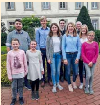
Ausgezeichnet: Siegerinnen und Sieger des Europäischen Wettbewerbs mit Funktionsträgern des KV Hameln