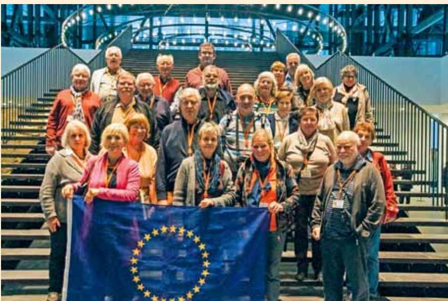
Studienfahrt nach Luxemburg: Der KV Hochtaunus war unterwegs.