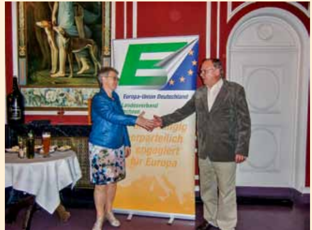
Zwischenstopp an der Elbe: Auf dem Weg nach Polen trafen die Karlsruher Gleichgesinnte in Dresden.