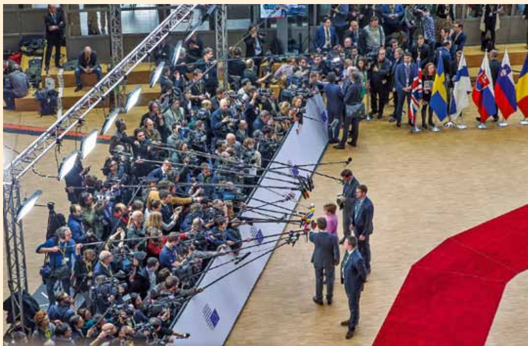
So stark wie beim EU-Gipfel im März kann Angela Merkel momentan nicht auftreten. Die Europa-Union hat klare Forderungen an die künftige Regierung verabschiedet.

Außerdem solle die kommende Regierung die von Emmanuel Macron geforderten Diskussionsforen zur Zukunft Europas ins Leben