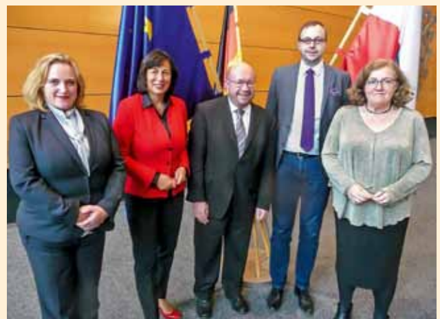
Gast im Thüringer Landtag: EuGH-Richter François Biltgen (M.)