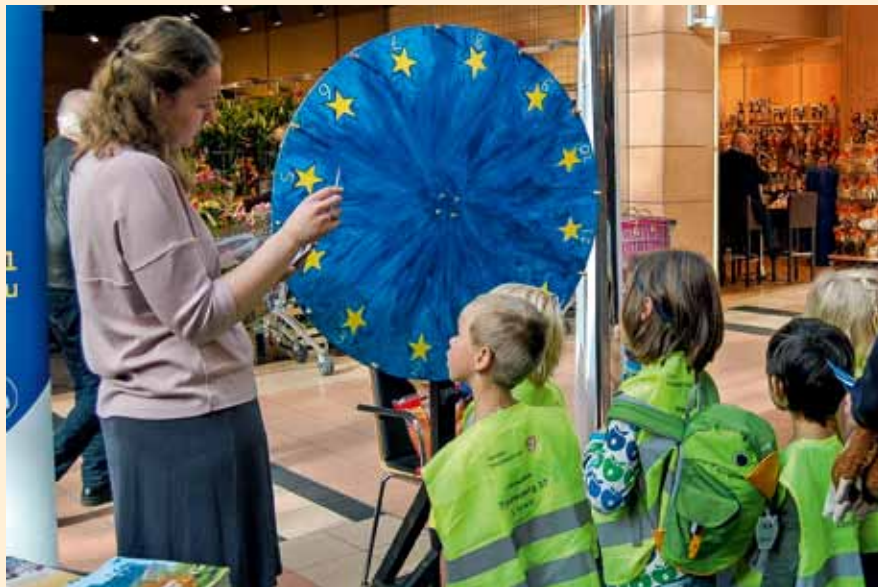
Kinder freuen sich über das Europa-Glücksrad an einem Info-Stand der Europa-Union.