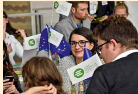
Gute Laune und intensive inhaltliche Arbeit beim JEF-BuKo in Bremen

Ein weiterer Höhepunkt war die BuKo-Party im Bremer Schnoor Viertel. Diese bot allen Teilnehmenden eine Gelegenheit, näher ins Gespräch zu kommen, den langen Tag mit vielen spannenden Eindrü-