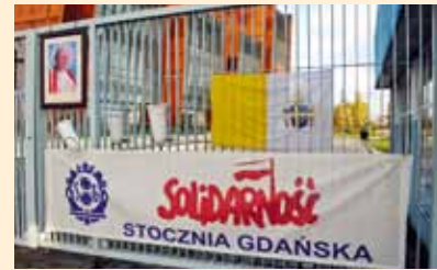
Anfang vom Ende des Sozialismus: Die Leninwerft in Danzig war eines der Ziele der Potsdamer Reisegruppe.