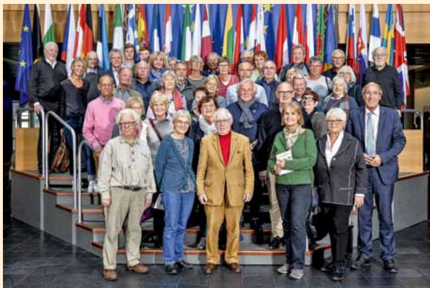
Die Reisegruppe aus Mayen-Koblenz im EP