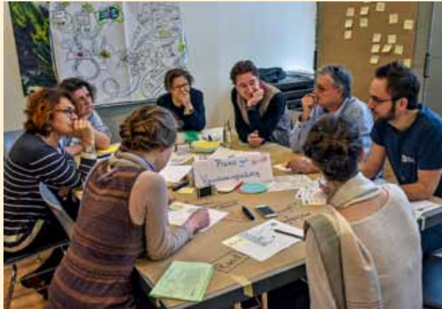
An den World-Café-Tischen gaben die Teilnehmenden Best Practice weiter und nahmen Tipps, Knowhow und Strategien für die eigene Verbandsarbeit mit.

Das Verbandstreffen in der Jugendherberge am Ostkreuz bot auch Gelegenheit, sich in kleineren Runden zusammenzusetzen und zu zahlreichen Themen auszutauschen. „Gut moderiert ist halb gewonnen“: Diese Erfah-