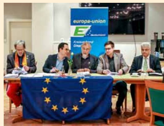
Die Direktkandidaten fast aller Parteien stellten sich der Diskussion.